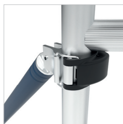
Installation facile des stabilisateurs