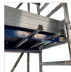
Poignées d'aide au montage permettant d'accrocher le matériel