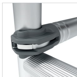
Liaison facile et sécurisée des garde-corps