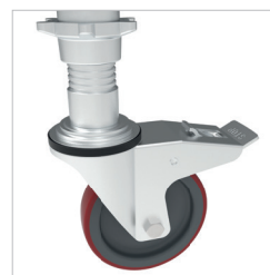
Roues à frein réglables Ø18mm